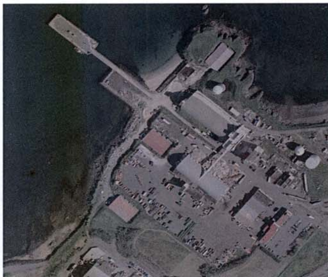
Mynd 1. Höfuðstöðvar Íslenska Gámafélagsins í Gufunesi

Íslenska Gámafélagið er með höfuðstöðvar í Gufunesi í Reykjavík en er einnig með starfsstöðvar í Árborg, Reykjanesbæ, Akureyri, Reyðarfirði, Egilsstöðum, Vestmannaeyjum og víðar. Fyrirtækið sér um að þjónusta flestar móttökustöðvar Sorpu, ásamt því að þjónusta fjölda annarra fyrirtækja. Á einstaklingsmarkaði þjónustar